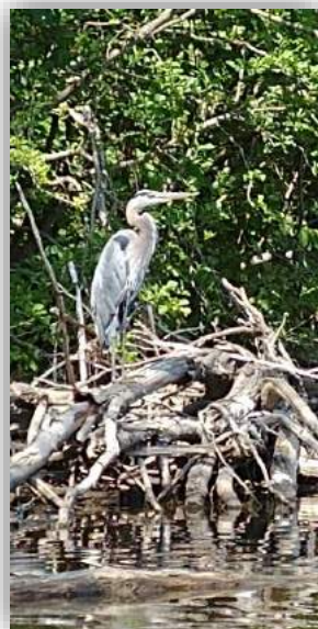
Ce Grand Héron a été photographié cet été près du pont Hillcrest.

Il est assez fréquent de voir un Grand Héron sur le lac Davignon. De tous les hérons du Canada, il est celui dont l'aire de répartition est la plus vaste. C'est le plus grand héron d'Amérique du Nord et un des plus imposants du monde. Il est surtout piscivore et peut vivre jusqu'à 20 ans. Il nidifie en petites colonies dans les arbres au-dessus de l'eau ou du sol. Le mâle et la femelle s'occupent tous les deux de couvrir les œufs et de nourrir les petits.