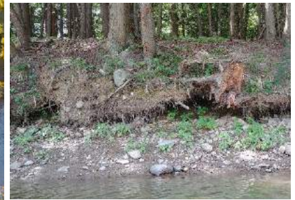
L'île aux mouettes en septembre 2020 et l'érosion des berges sur le bassin versant.